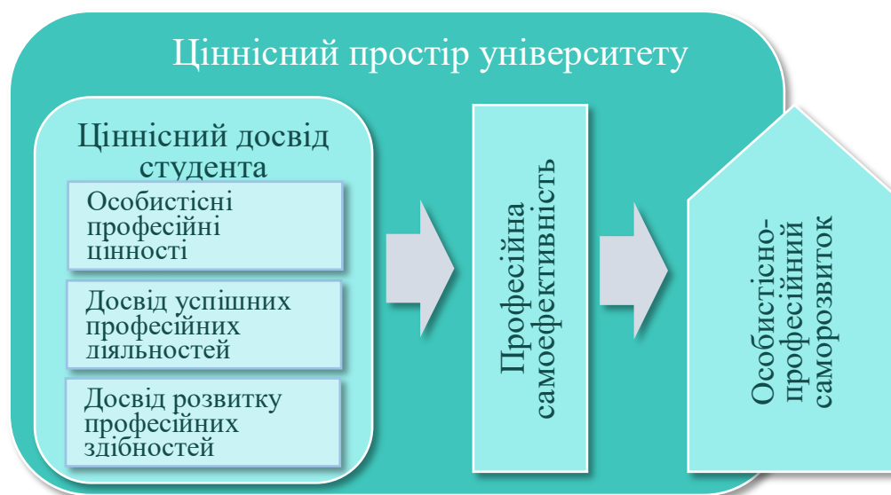
Рис. 1. Ціннісний простір університету, орієнтований на особистісно-професійний саморозвиток студентів

за високого рівня професійних домагань найменша невдача може призвести до зниження самоефективності й падіння мотивації. На рис. 1. схематично зображено вплив ціннісного простору університету на накопичення ціннісного досвіду, формування професійної самоефективності й особистісно-професійного саморозвитку студентів.