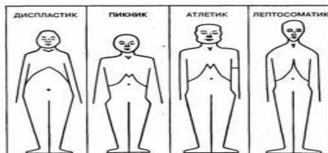
Рис. 3. Типи конституцій за Е. Кречмером

Німецький психіатр Ернст Кречмер (1888 – 1964) у своїй праці «Будова тіла та характер» (1921 р.) спробував на базі своєї психіатричної практики визначити зв'язки, що існують між будовою тіла та психічними особливостями власника цього тіла. За Е. Кречмером існують три основні типи будови людського тіла, які можливі не лише так би мовити, в «чистому вигляді», а й в різних комбінаціях між собою. За морфологією Кречмер виокремив такі психосоматичні типи і відповідні їм темпераменти: лептосоматик, пікнік, атлетик і диспластик (рис. 3) [5].