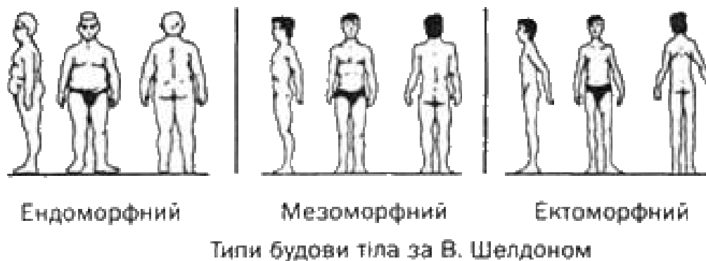
Рис. 4. Типи будови тіла (за В. Шелдоном)

У середині ХХ століття американський антрополог Вільям Шелдон (1899 – 1977), проаналізувавши 4000 фотографій оголених студентів коледжу і провівши кореляційний аналіз між ознаками зовнішності і 50 поведінковими характеристиками, робить висновок, що більшість людей не входить у жорсткі рамки тієї чи іншої класифікації, а займає проміжне положення [7]. Ось чому він запропонував систему класифікації конституційних типів, виходячи не з дискретних типів, а з проміжних форм. За основу він взяв те, що розвиток систем організму починається з трьох зародкових листків: ендодерми, з якої утворюються органи травлення; мезодерми, з якої складаються кістки, м'язи і легені; ектодерми, з якої утворюються шкіра, волосся, нігті, нерви і мозок (головний і спинний). Відповідно, він виділив три типи будови тіла: екторморфний, мезоморфний, ендоморфний (рис. 4).