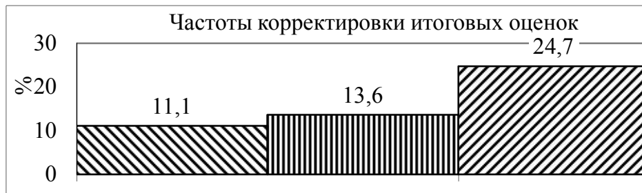
Рис. 1. Корректировка итоговых оценок по результатам дополнительной сессии тестирования

уточнения, при этом по результатам дополнительных сессий тестового контроля в 11,1% она была скорректирована в сторону увеличения.