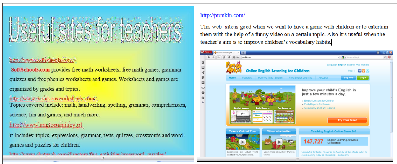
Рис. 2. Приклади аналізу навчальних веб-сайтів

Хід виконання: студенти діляться на групи, обговорюють власний досвід використання навчальних веб-сайтів, відвідують веб-сайти, запропоновані викладачем та роблять аналіз веб-сайтів за власним вибором, але за зразком представленим викладачем.