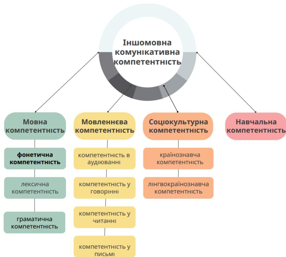
Рис. 1. Місце фонетичної компетентності у структурі іншомовної комунікативної компетентності.

Беззаперечно, фонетична компетентність займає ключове місце у структурі іншомовної комунікативної компетентності. Це обумовлено тим, що репродукція й продукція усного й письмового мовлення не можливі без знань із фонетики іноземної й рідної мов. Методист-вчений М. Olloqova у своїй праці «Development of Students' Pragmatic Competence through Phonetic Knowledge» детально описує значення вивчення фонетичних концепцій, стверджуючи, що фонетичні знання для учнів школи з є основою для читання й письма протягом усього періоду грамотності (Olloquva, 2022, с. 1541–1542).