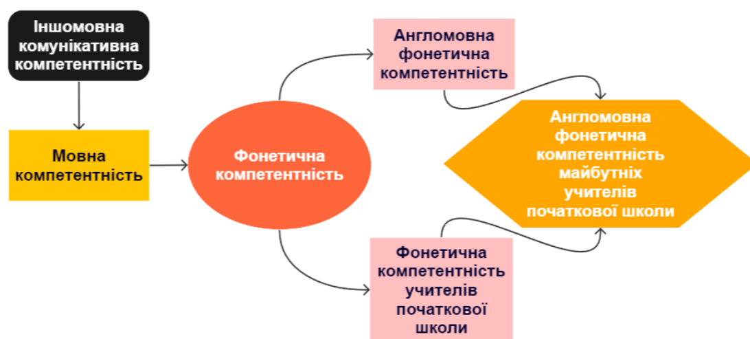
Рис. 2. Синтез поняття «англомовна фонетична компетентність майбутніх учителів початкової школи».

Отже, уточнивши поняття англомовної фонетичної компетентності вчителів початкової школи, ми окреслимо чіткі напрями підготовки вчителів початкових класів у закладах вищої освіти.